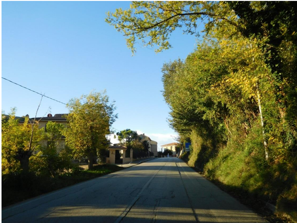
Foto 3 - Fessurazioni longitudinali della pavimentazione stradale connesse anche alla presenza di sottoservizi ed usura dello strato superficiale.