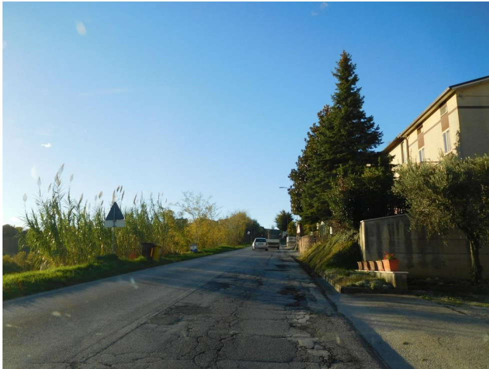
Foto 1 - Fessurazioni longitudinali della pavimentazione stradale, connesse anche alla presenza di sottoservizi, ed usura dello strato superficiale